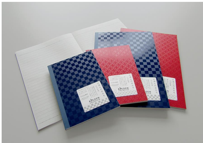
写真:「ノートブック〈ReEDEN PREMIUM〉 市松紋様・七宝紋様」

(※1)コクヨショーケース: http://www.kokuyo-shop.jp