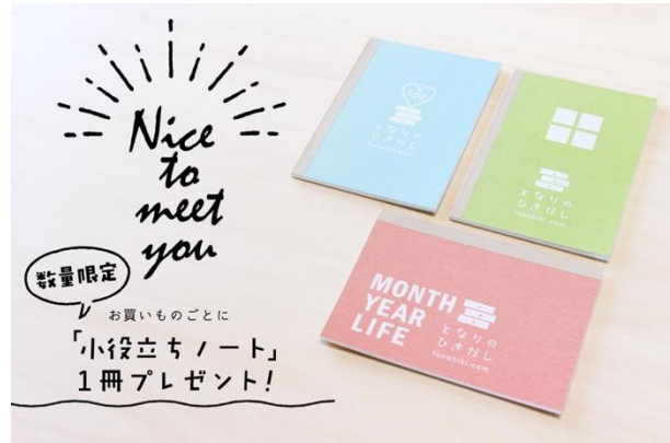
はじめてのひきだしキャンペーン 数量限定の特別ノートをプレゼント