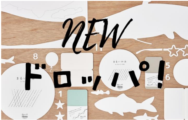
オリジナル商品 ドロップパ！シリーズ お絵かきをパーティーのように楽しむツール

はじめてのひきだしキャンペーン： https://www.tonahiki.com/blog/campaign/2021y1/