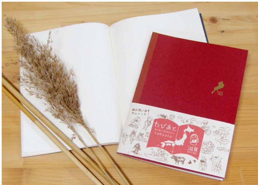
写真:「旅のお供ノート<たびあと>」

袋綴じで裏合わせになっているので、インクの「裏抜け」が軽減され、次のページを汚しません。