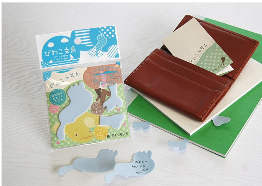
写真:「びわこふせん」

滋賀県内の主要文具店はじめ観光地のお土産売り場、コクヨ株式会社直営の通販サイト(※)等で販売します。(※)コクヨショールーム: http://www.kokuyo-shop.jp/shop