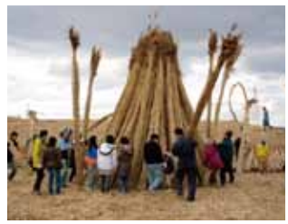
鶴殿ヨシ原のヨシ刈り