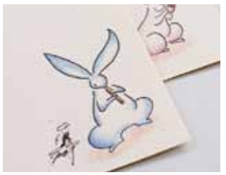
東儀秀樹氏イラストのヨシ紙