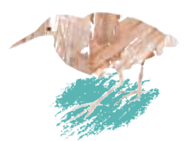
ヨシ原の鳥:ヨシゴイ